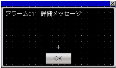
ウィンドウ画面 W-30001 : アラーム詳細