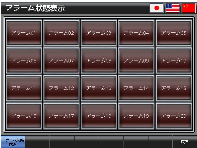
ベース画面 B-30002 : アラーム状態表示 2