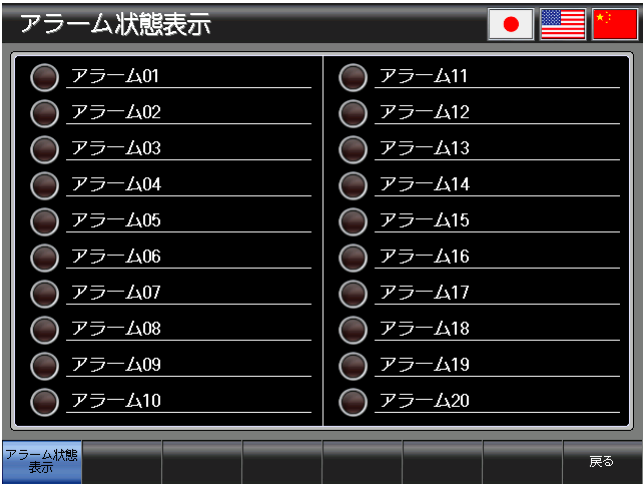
ベース画面 B-30001 : アラーム状態表示 1