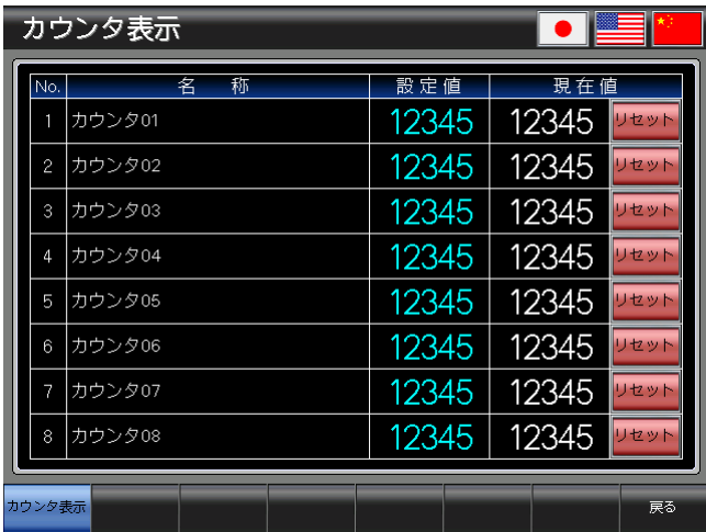
ベース画面 B-30004 : カウンタ表示 4