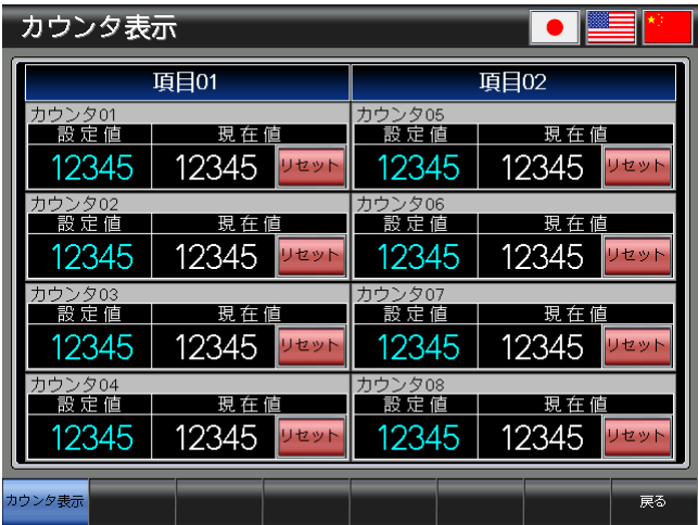
ベース画面 B-30001 : カウンタ表示 1