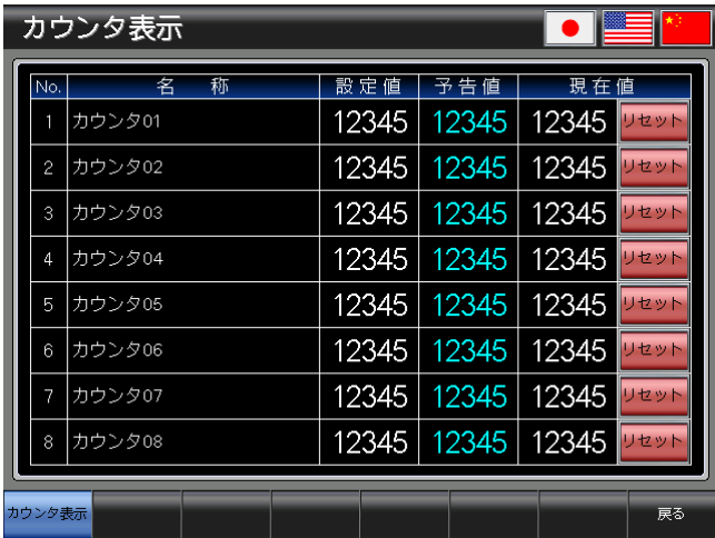
ベース画面 B-30003 : カウンタ表示 3