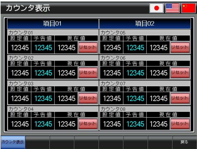
ベース画面 B-30002 : カウンタ表示 2