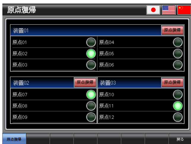
ベース画面 B-30001 : 原点復帰 1