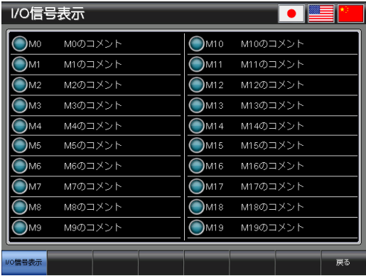
ベース画面 B-30004 : I/O 信号表示 4