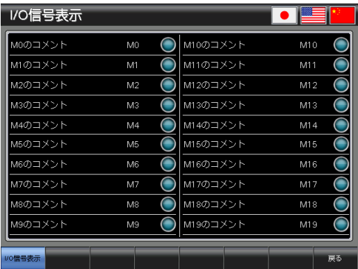
ベース画面 B-30003 : I/O 信号表示 3