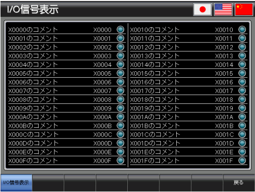
ベース画面 B-30001 : I/O 信号表示 1