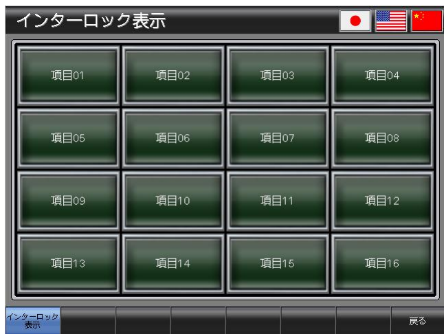
ベース画面 B-30002 : インターロック表示 2