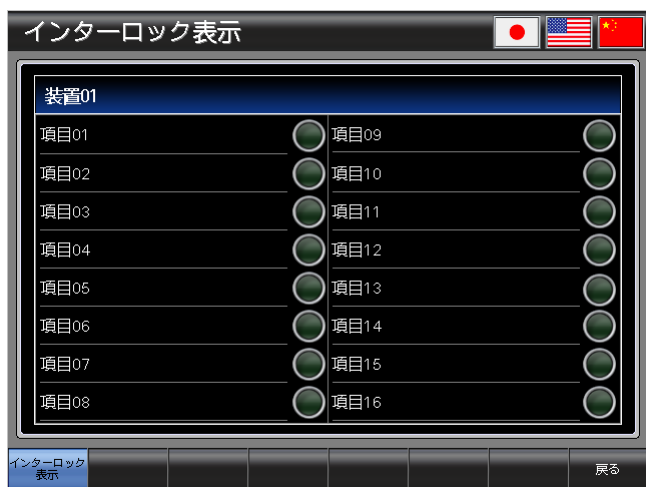
ベース画面 B-30001 : インターロック表示 1