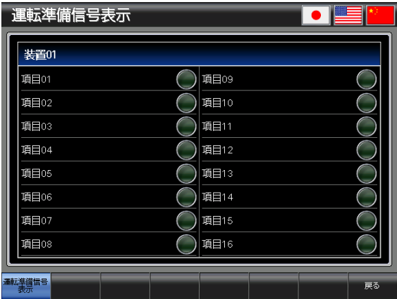
ベース画面 B-30001 : 運転準備信号表示 1