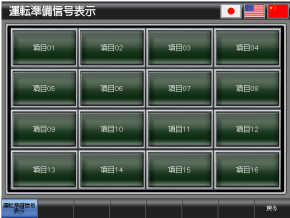
ベース画面 B-30003 : 運転準備信号表示 3