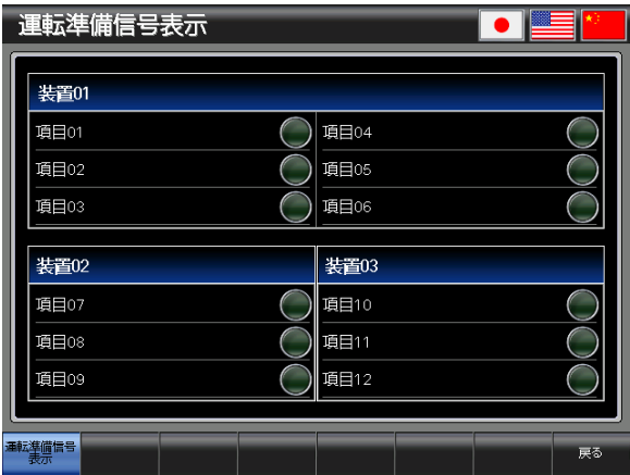
ベース画面 B-30002 : 運転準備信号表示 2