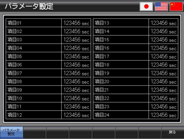
ベース画面 B-30002 : パラメータ設定 2