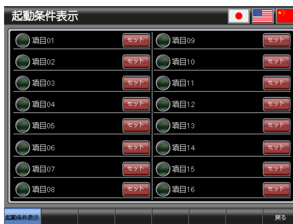
ベース画面 B-30003 : 起動条件表示 3