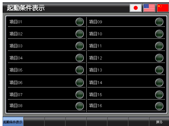
ベース画面 B-30002 : 起動条件表示 2