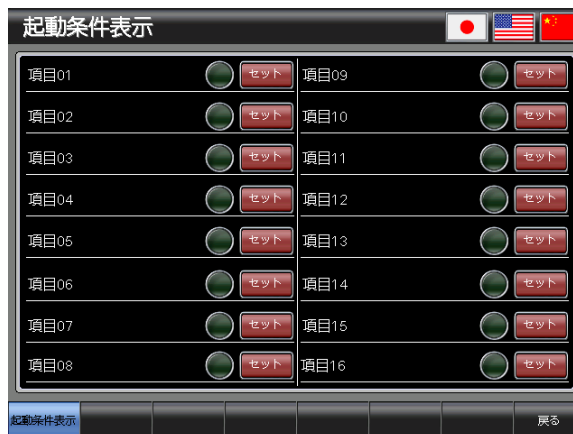
ベース画面 B-30004 : 起動条件表示 4