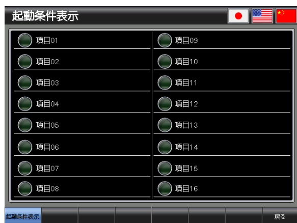
ベース画面 B-30001 : 起動条件表示 1